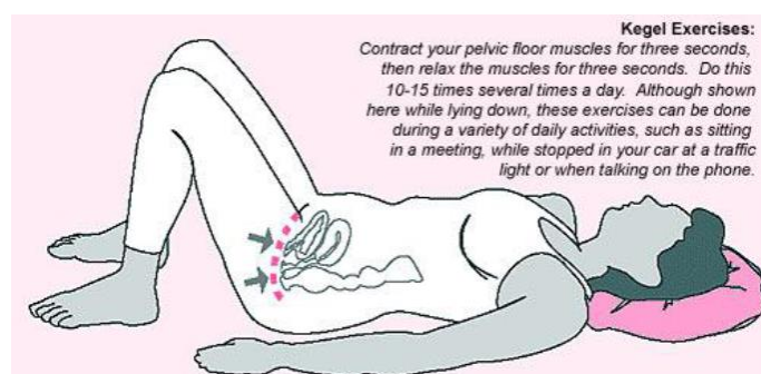
Figura 3 – Exemplo de exercício de Kegel.

A cinesioterapia é de extrema importância, seu objetivo é aprimorar o tecido musculoesquelético, podem ser utilizados os exercícios de Kegel, visando o trabalho da musculatura perineal (figura 3) (SILVA e OLIVA, 2011). O treinamento muscular do assoalho pélvico é prescrito de forma individual, baseado na avaliação funcional de cada paciente, de acordo com a sua graduação de força, propriocepção e tolerância (ALVES, 2018).