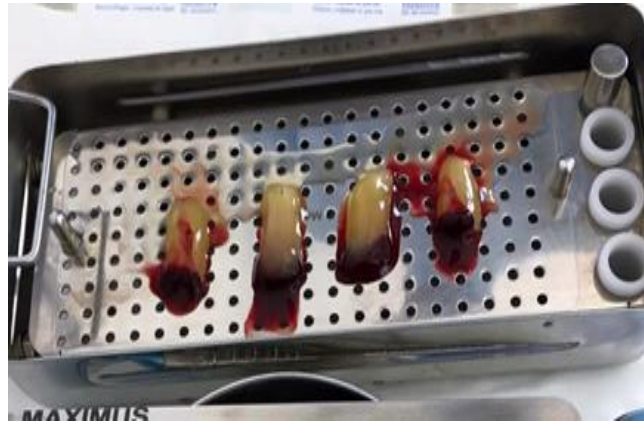
Figura 4 - Preparação dos concentrados L-PRF.

L-PRF estarem prontas no kit de compressão, elas já podem ser usadas no sítio cirúrgico desejado (Figura 6). 10