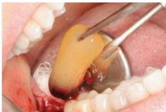
Figura 6 - Membrana de L-PRF sendo inserida no sítio cirúrgico

Fonte: Vasconcelos, Teixeira e Cruz 11(p28)