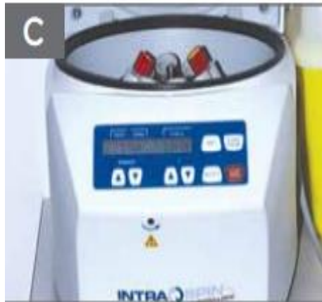
Figura 2 - Tubos de ensaio com sangue periférico do paciente em centrífuga