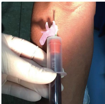
Figura 1 - Obtenção do sangue periférico do paciente

Inicia-se pela punção venosa; obtenção de 4 a 8 tubos de 10 ml cada, com sangue periférico (Figura 1); centrifugação a 3000 rotações por minuto (rpm) durante pelo menos 10 minutos (Figura 2). 10