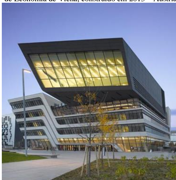
Figura 5: Biblioteca e Centro de Aprendizagem da Universidade de Economia de Viena, construído em 2013 – Áustria

Arquiteta correlata: Zaha Hadid, a fachada da biblioteca foi inspirada na Biblioteca e Centro de Aprendizagem da Universidade de Economia de Viena, construída na Áustria, os volumes suspensos trazendo movimento, como se a edificação estivesse se debruçando sobre o observador. O partido arquitetônico da fachada da biblioteca surgiu a partir de um livro aberto sobre a porta principal, usando a forma de um livro como complemento do poder da leitura para o ser humano, conferindo movimento ao volume da fachada.