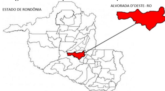
Figura 1: Localização da cidade no mapa do estado

O município possui a agricultura e a pecuária como base da sustentação econômica. No setor agrícola são produzidos os gêneros alimentícios primordiais como arroz, feijão e milho, além do cultivo de grãos de café e o gado leiteiro (IBGE, 2010; 2019).