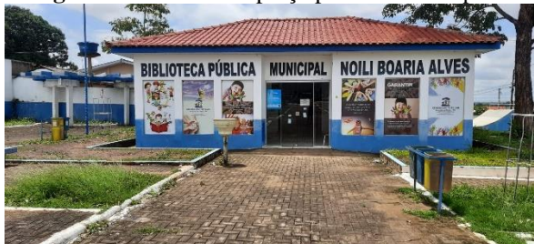
Figura 3: Biblioteca e praça pública Municipal