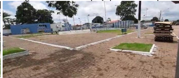
Figura 4: Biblioteca e praça pública Municipal